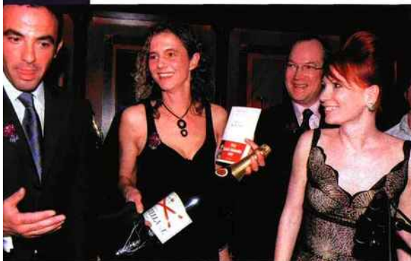
À g., Nikos Aliagas (TF1, LCI), président du jury, et la lauréate, Delphine de Vigan.

Parrainé par Patrick Poivre d'Arvor, le Prix littéraire Saint-Valentin qui récompense le meilleur roman d'amour de l'année a été remis lors de "La nuit du roman d'amour" organisée à La Villa à Paris. C'est Delphine de Vigan qui a été l'heureuse récipiendaire de ce prix pour "Un soir en décembre" chez J.C. Lattès.