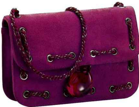
Mini-sac Bbag par Renaud Pelligrino en velours fuchsia et cristal pivoine. BACCARAT