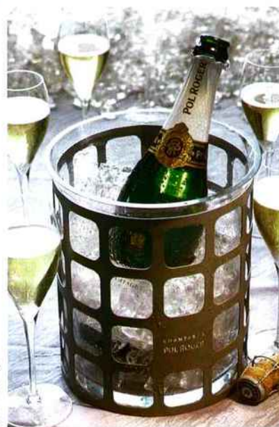
Champagne 1998 et son sceau en métal et cristal. POL ROGER