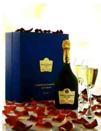
Coffret Comtes de champagne blanc de blanc contenant un millésime et deux flûtes en cristal Baccarat. TAITTINGER