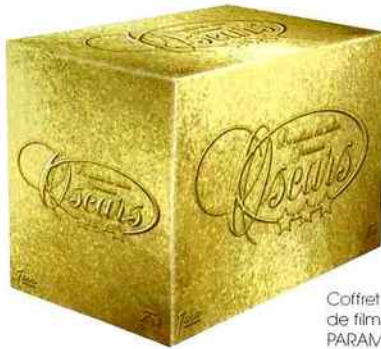
Coffret de sept DVD de films oscarisés. PARAMOUNT