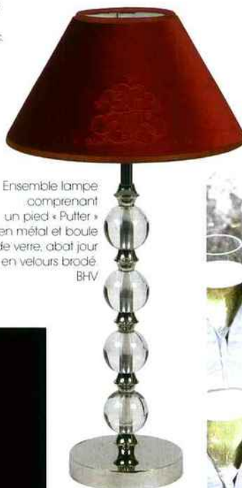
Ensemble lampe comprenant un pied « Putter » en métal et boule de verre, abat jour en velours brodé BHV