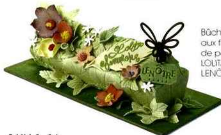
Bûche de Noël fourée aux fruits et recouverte de pâte d'amandes. LOLITA LEMPICKA pour LENÔTRE