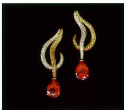
Boucles d'oreilles en or jaune pavées de diamants et rubis. LÉON HATOT