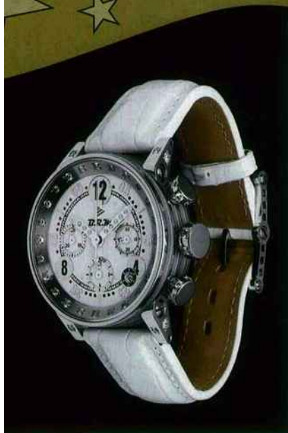
Montre V9 version joaillerie, avec diamants et bracelet en croco blanc. BRW