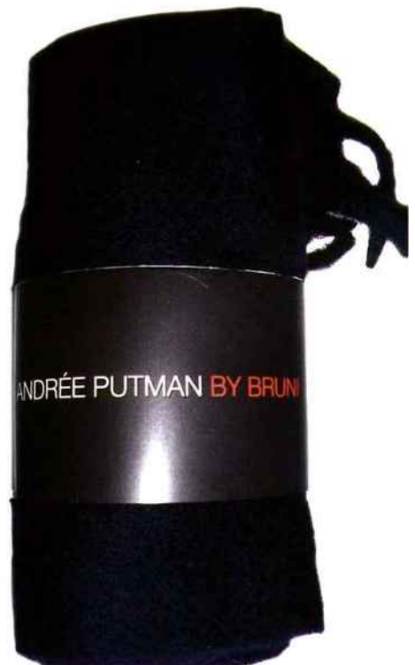
Plaid en cachemire noir. ANDRÉE PUTMAN pour BRUNI